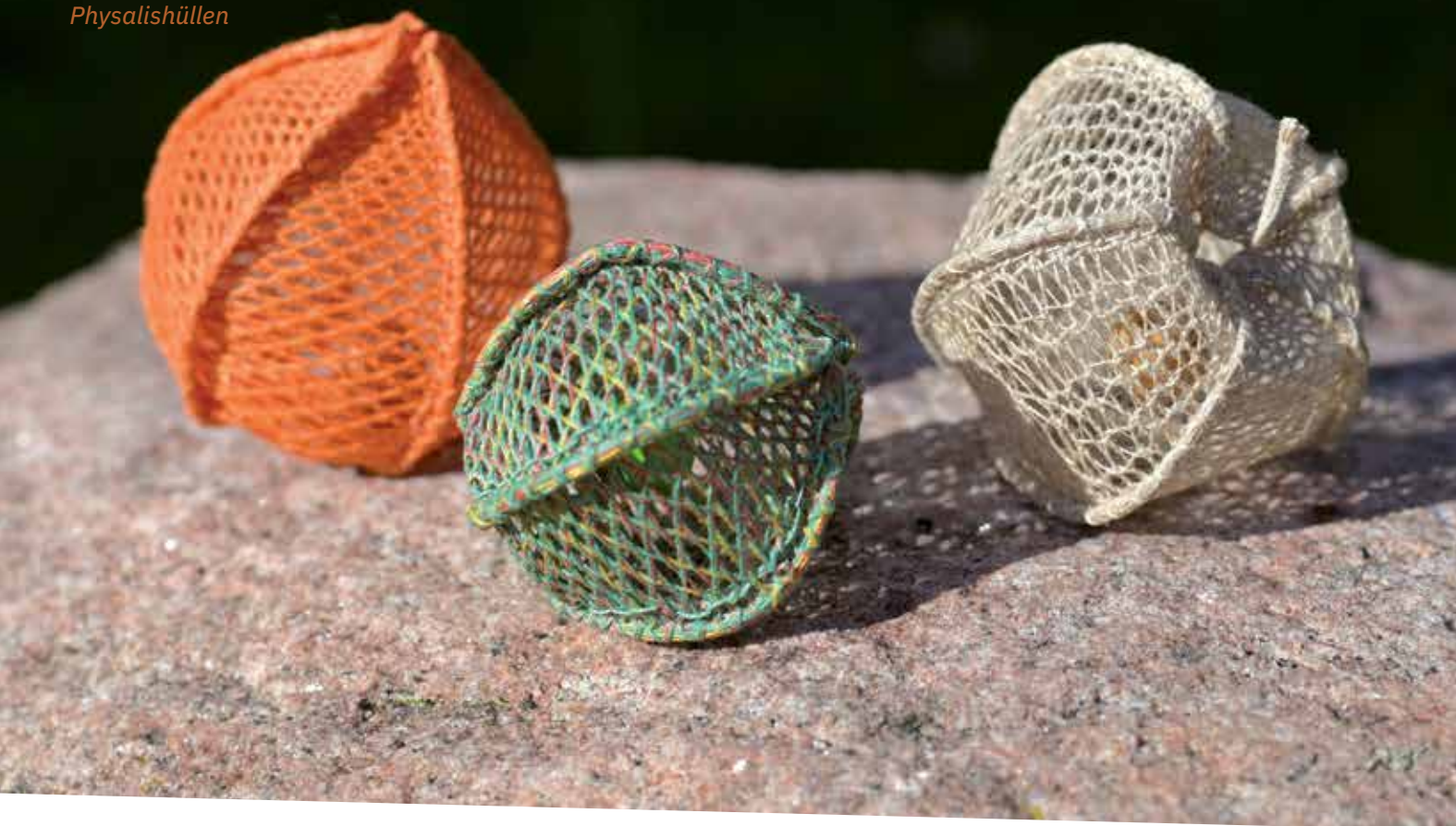
Filigran geklöppelte Physalishüllen

Die Ursprünge der Klöppelkunst reichen bis ins 16. Jahrhundert zurück. Wer die Kunst erlernen möchte, wird feststellen, dass Kenntnisse der historischen Spitzenarten die Basis für moderne Designs bilden.