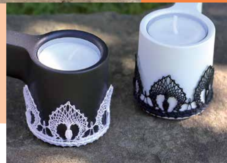
Mit Klöppelspitze verzierte Teelichthalter

33021 Kurs , Wilma Kikuth-Wesberg Witten, vhs Seminarzentrum Mi, 11.02.2026, 19:30 – 21:45 Uhr, 10 x 90,00 EUR